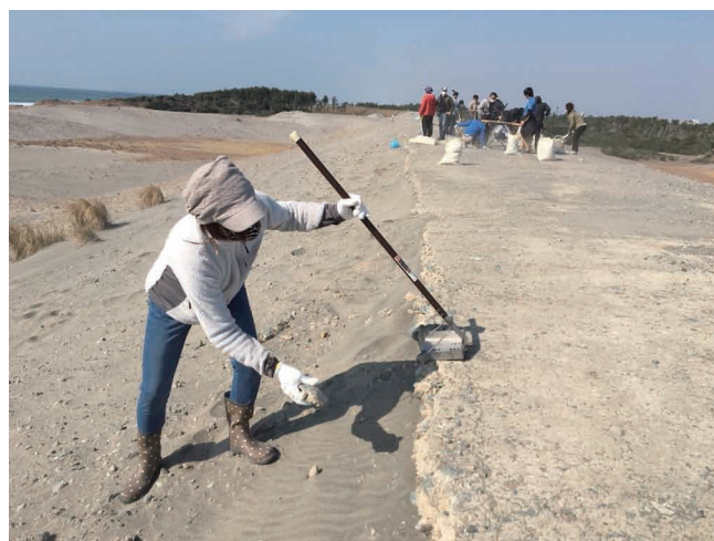
＜中田島砂丘の防潮堤の環境整備＞