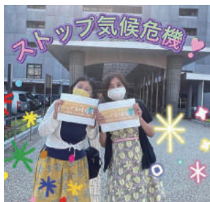
●ストップ気候危機キャンペーンに参加 市役所前にて(6/9)