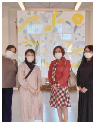
●遠州織物染色「染む」鑑賞 鴨江アートセンターにて(11/2)