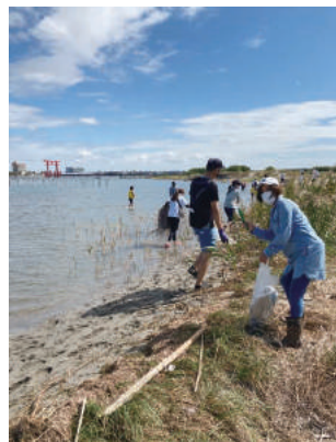
●弁天島の南にある無人島「いかり瀬」で、ゴミ拾い(10/10)